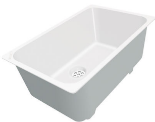
Weißer Wanne 8153 100