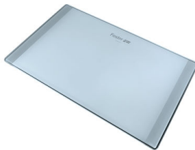
Schneidebrett aus Glas 8633 300